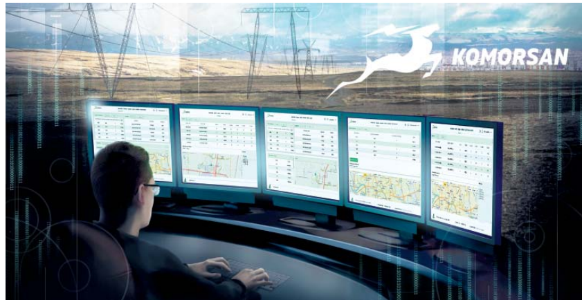
▲ Рис. 1. КОМОРСАН – комплексная система мониторинга и управления РЭС

Точечная установка оборудования на наиболее аварийном участке позволила сразу решить острую проблему энергосистемы. Благодаря аддитивному характеру внедряемой системы мониторинга компании “АНТРАКС”, решение удалось легко достроить и тиражировать. Данные первых комплектов устройств сразу же собирались и анализировались геоинформационной системой, передающей итоговую информацию в ранее развернутую в Чистопольском РЭС SCADA-систему